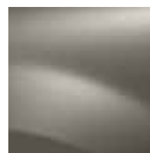
SIVA BASALTE KNM (TE)