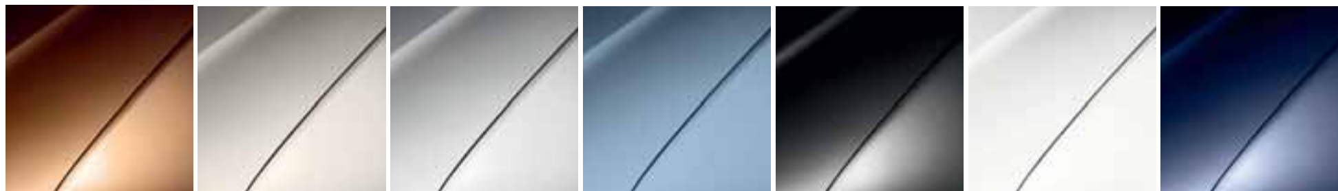
SMEDA (TE CNA)